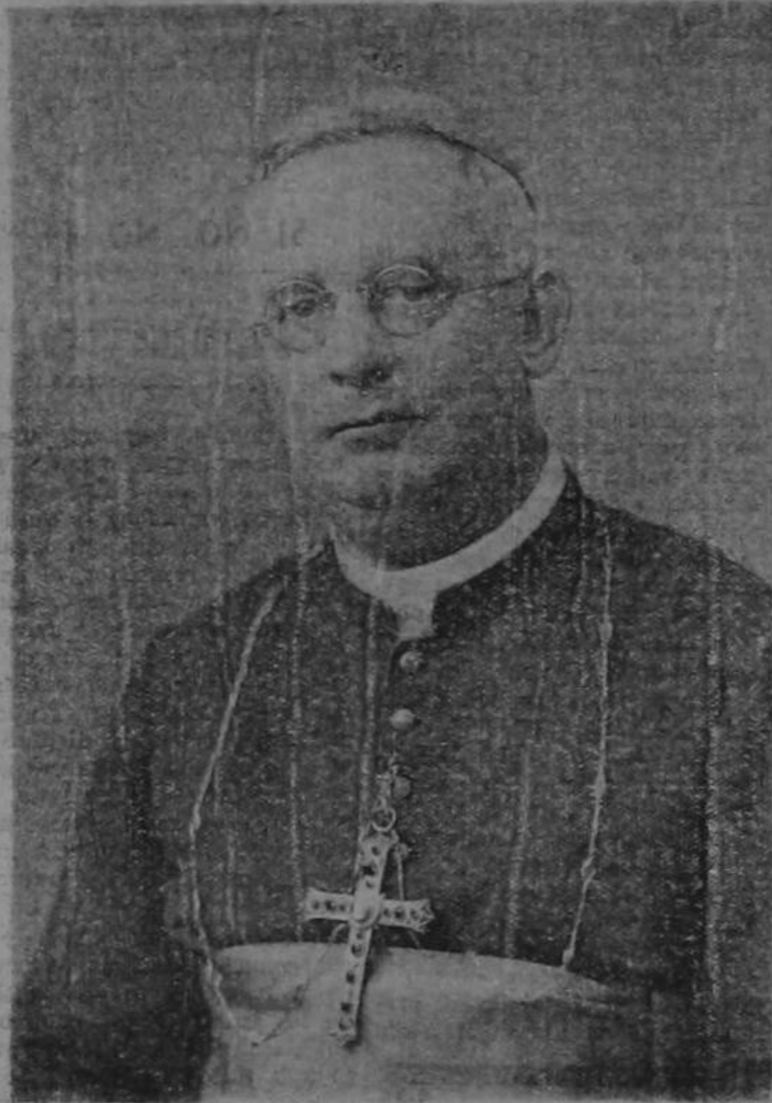
Monseñor don JUAN ODENDAHL

Por eso, amados hermanos e hijos os invitamos a que nos acompañéis en el espíritu durante nuestro viaje, en particular con vuestras oraciones para que, guiados de Dios, lleguemos bien al término de nuestro viaje y regresemos finalmente sa-